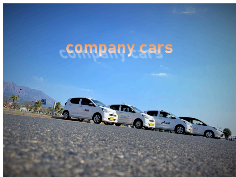
各部署の愛車たち！