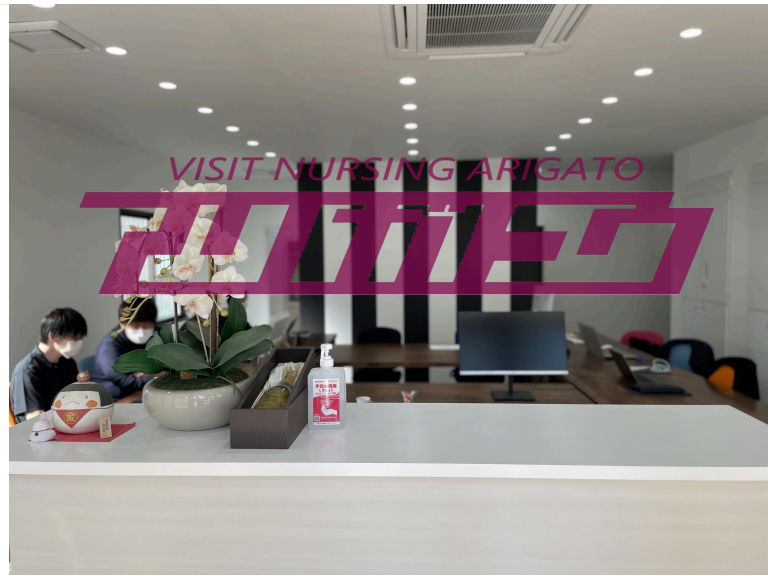
働き安いスッキリとしたオフィスで！