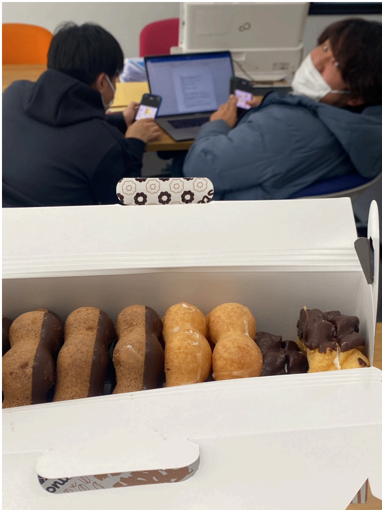
たまには息抜きもしながら！