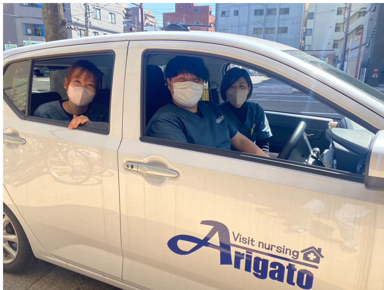
営業活動も頑張っています！