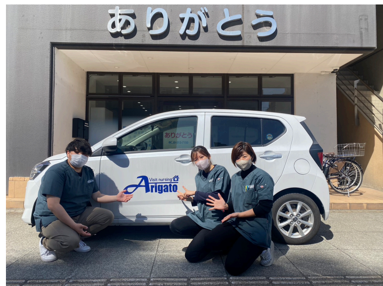
愛車の前でパシャリ！