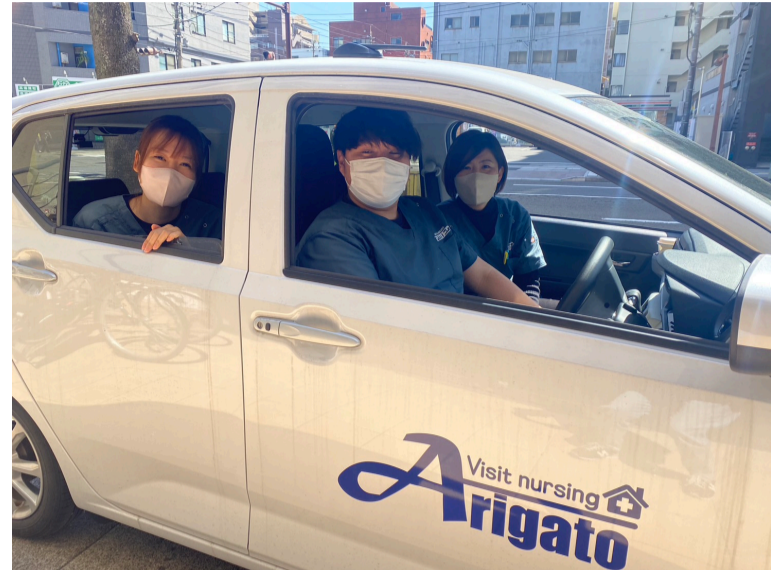
営業活動も頑張っています！