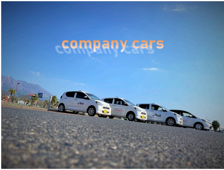
各部署の愛車たち！