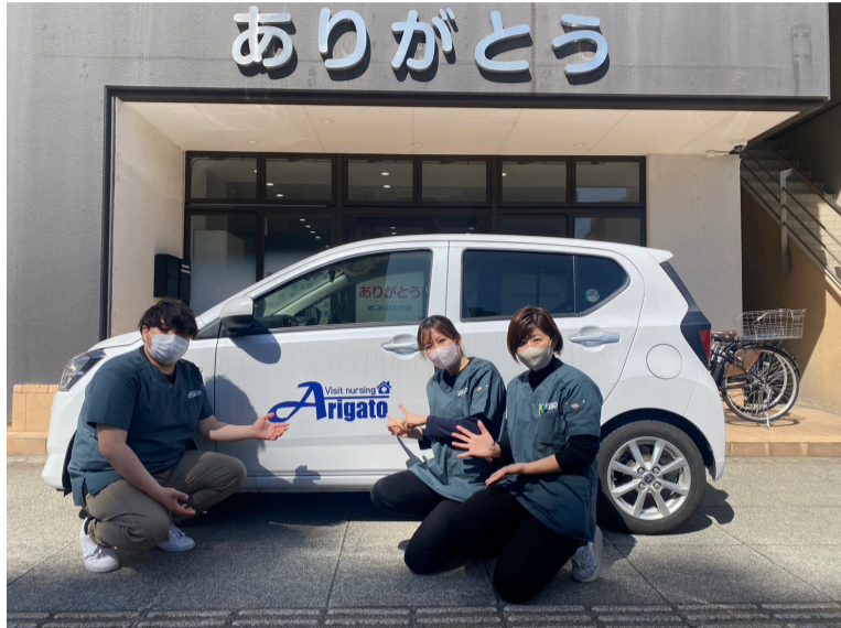
愛車の前でパシャリ！