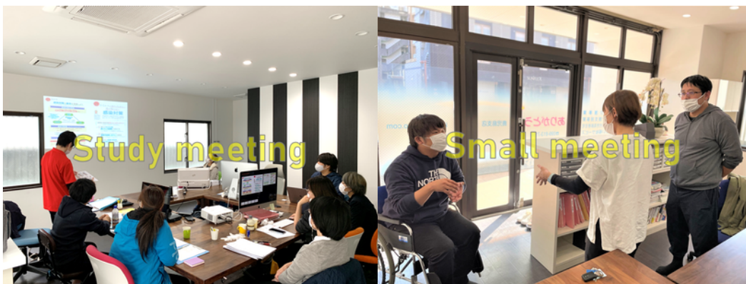
最新の情報をスタッフ全員で共有します！