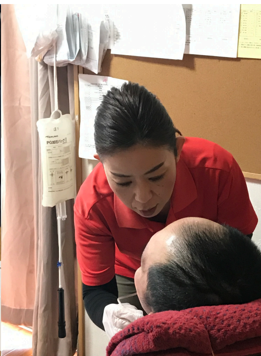
スタッフ全員で、利用者様の生活を支援しています！